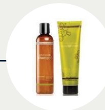
Salon Essentials Shampoo & Conditioner