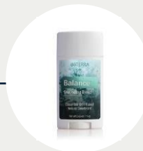
dōTERRA Natural Deodorant mit Balance