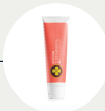
On Guard Zahnpaste